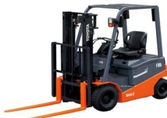
8FBN10 – 30 Xe điện 1.0t – 3.0t Lắp ráp Trung Quốc / China