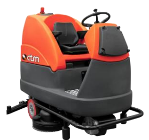
Kron S3/ M2/ L2 Capacity: 6200 - 8540 m 2 /h Floor Scrubber Driers