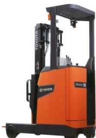
8FBR10-30 Reach Truck Xe Đứng Lái 1.0t – 3.0t Nhật Bản / Japan