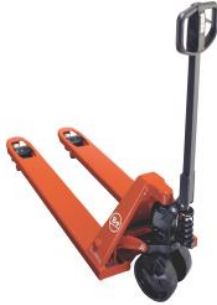
BT Hand Pallet Truck (for open pallet) Xe Nâng Tay BT (Chỉ dùng pallet mở)