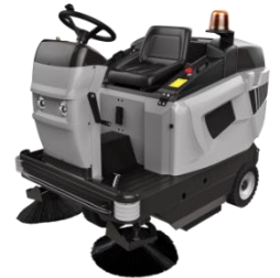
CSW R810 Capacity Battery: 9700 m 2 /h Capacity Diesel: 9700 m 2 /h Sweepers