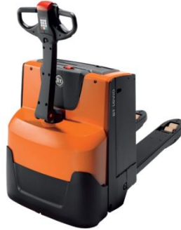
BT Power Pallet Truck Xe bán tự động không khung (Chỉ dùng pallet mở)