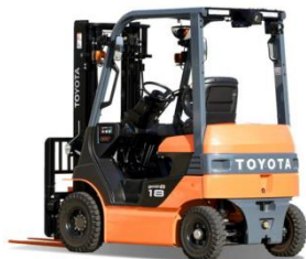
8FB10-35 Xe điện 1.0t – 3.5t Nhật Bản / Japan