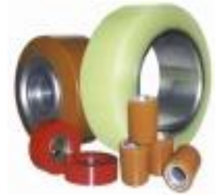
PU Wheel For All Brand of Truck Các loại vỏ PU cho Reach Truck