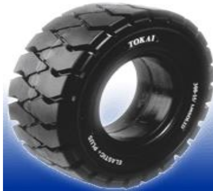
Solid Tire For All Brand of Truck Bánh đặc cho các loại xe