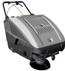
CSW R788 Capacity Battery: 3700 m 2 /h Capacity Gasoline: 3700 m 2 /h Sweepers