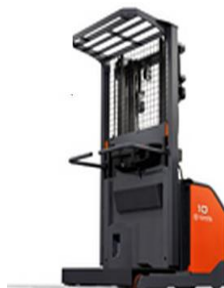
8FBP07-15 Order Picker Xe Nâng Người 0.7t – 1.5t Nhật Bản/Japan