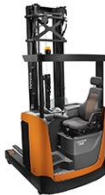
8FBRE12-20 Reach Truck Xe Ngồi Lái 1.2t – 2.0t Thụy Điển/ Sweden Hiệu Toyota