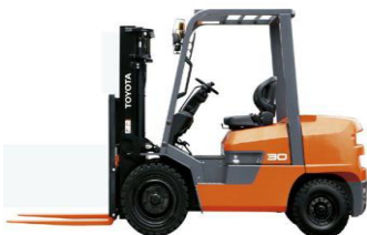
FDZN/FGZN 20 – 30 2.0t – 3.0t Lắp ráp Trung Quốc / China