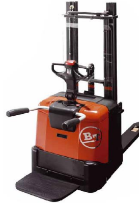
BT Stacker Lifter Loại bán tự động có khung (Chỉ dùng pallet mở)