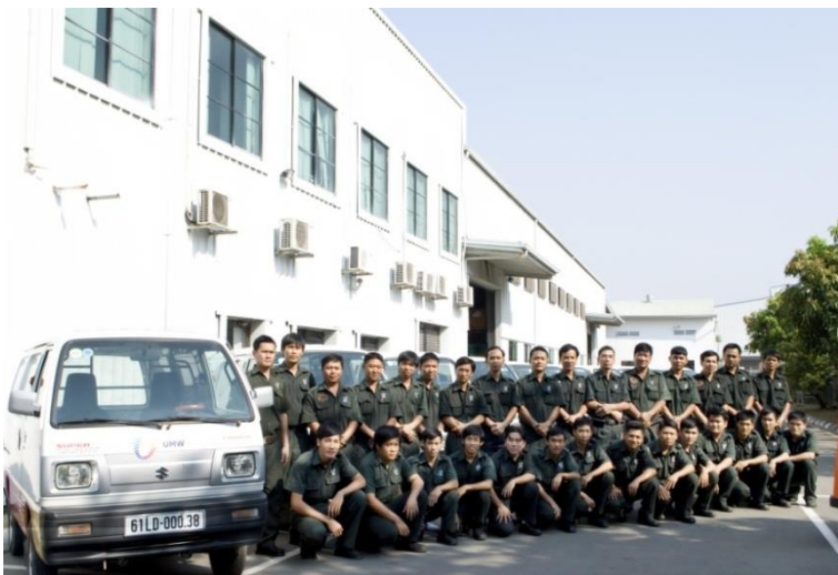
Adequate service team to improve service quality Đội ngũ dịch vụ bảo trì mạnh, nâng cao chất lượng dịch vụ