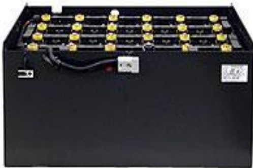
Traction Battery Bình điện

Preventive maintenance services contract Cung cấp hợp đồng bảo dưỡng xe nâng