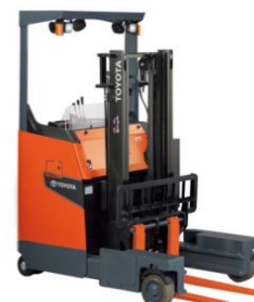
8FBS10-25 Xe Đứng Lái 4 chiều Nhật Bản