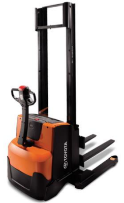
BT Stacker Lifter Loại bán tự động có khung (Dùng cho cả pallet đóng)