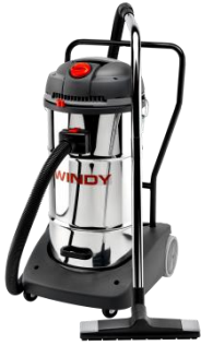
Windy 365 IR Air Suction: 195 l/s Total Volume: 65 litres Wet & Dry Vacuum Cleaners