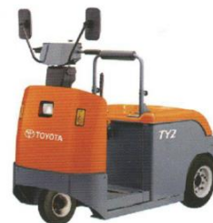
4CBTY2 Electric Towing Tractor Xe Đầu Kéo Nhật Bản/Japan