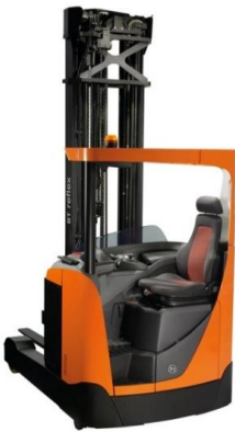
BT Reach Truck Xe Reach Truck BT