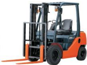
8FD/8FG10-35 1.0t – 3.5t Nhật Bản / Japan