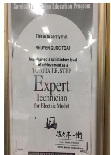
Professionally trained technician Kỹ sư được đào tạo chuyên nghiệp