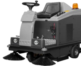
CSW R792 Capacity Battery: 6200 m 2 /h Capacity Gasoline: 8280 m 2 /h Sweepers