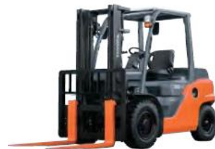
8FD/FG35-50N / 8FD60-80N 3.5t – 8.0t Lắp ráp Trung Quốc / China