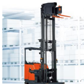
8RFBA 10-15 Xe nâng đứng lái Three Way Nhật Bản