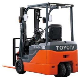
8FBE10-20 Xe điện 1.0t – 2.0t Nhật Bản / Japan