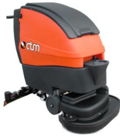
Sigma Capacity 2250 – 4275 m 2 /h Floor Scrubber Driers