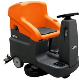
Kron Pico/ Zero Capacity 3250 - 4100 m 2 /h Floor Scrubber Driers