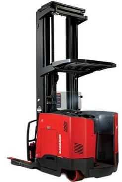
Raymond Model 7000 Series Reach Truck Double Deep and Cold Room