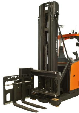
BT VNA Truck (Very Narrow Aisles) Xe VNA BT (Dùng cho nơi hẹp)