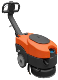
Flick Capacity: 1260 m 2 /h Floor Scrubber Driers